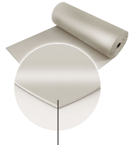
PVC homogène avec couche de finition anti-dérapante